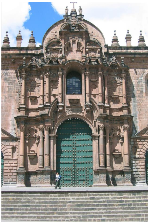
Portada de pies también llamada del Perdón de la catedral del Cusco. Su diseño es propio del núcleo regional surgido a mediados del siglo XVII. Constituye la cabeza de serie de una traza con aportes peruanos tales como la cornisa abierta en porciones de arco en el entablamento del primer cuerpo.

A finales del siglo XVII y a lo largo del XVIII, los núcleos arquitectónicos y artísticos con propuestas propias e innovadoras se multiplicaron. La formación no fue estrictamente académica, sino más bien empírica y generada en los talleres de los maestros. Esta situación forjó formas de expresión que fueron sumamente creativas e imaginativas, si bien en ciertos casos alejadas de los cánones estéticos europeos renacentistas y posteriormente barrocos.