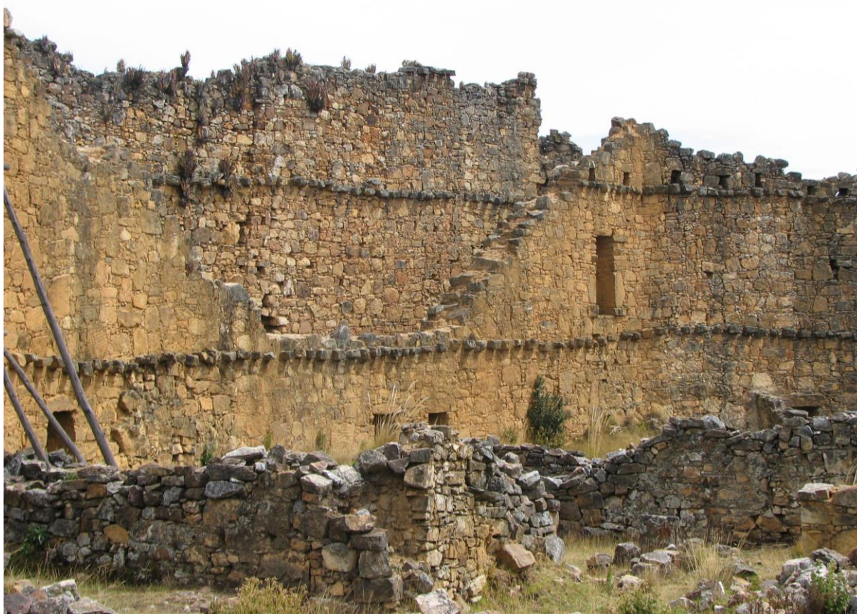
Departamento de La Libertad. Conjunto arqueológico de Marcahuamachuco, ocupado entre los 400 y 1532 años d.C. Es el complejo más grande de la sierra norte del Perú. A pesar de ello, todavía no cuenta con una delimitación oficial, que establezca su área intangible, que es necesaria para establecer su conservación y tutela.

Los restos y testimonios del patrimonio inmueble y mueble —situados cronológicamente entre los 12 000 años a.C. y el año 1532 d.C.— que constituyen la plasmación tangible de las culturas del antiguo Perú, han llegado hasta el presente de manera fragmentada, debido a distintas circunstancias y escenarios. Aunque este patrimonio es el que se encuentra profundamente arraigado en el inconsciente colectivo, que tiene una ambigua percepción de un pasado grandioso —aunque remoto— esto no significa que su conservación y gestión haya logrado estructurarse de manera apropiada.