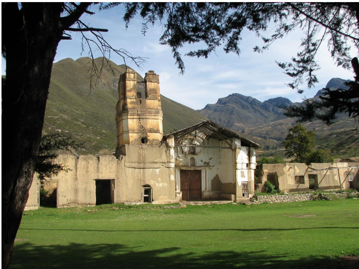
Departamento de Cajamarca. Capilla de la antigua hacienda Marcamachay, edificada a mediados del siglo XVIII. Su estado de abandono es patente a pesar de los denodados esfuerzos de los pobladores que quieren salvar las efigies de sus santos protectores. Imagen: propia, 2012

Como corolario, esta arquitectura no se considera como generadora de recursos económicos, y es además costosa y difícil de mantener en buen estado. Por lo tanto, se abandona por completo hasta su colapso y destrucción o, si es posible y existe una fisura legal, ser demolida para posibilitar obras nuevas, aplicando el siempre válido mito del progreso. Las restantes manifestaciones de arte, tales como la pintura mural o sobre lienzo, las diversas expresiones de escultura y orfebrería, suelen no comprenderse a nivel conceptual. Son asumidas como obras costosas, de escasa utilidad y asociadas a grupos sociales adinerados.