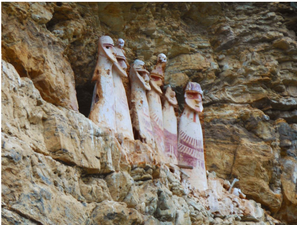
Departamento de Amazonas. Sarcófagos de Karajja, de la cultura Chachapoya (800-1470 años d.C.). Están emplazados como otros de esta cultura, en lo alto de un barranco de difícil acceso. En el interior de estos sarcófagos, hay una momia sentada sobre un pellejo y envuelta en telas mortuorias, acompañada de ofrendas.

En años recientes, el Ministerio de Cultura inició algunos modestos intentos de articular el patrimonio arqueológico con organizaciones locales no gubernamentales, juntas de vecinos y pobladores en general, para evitar la depredación sistemática y frenar su destrucción. Hasta el presente no es posible afirmar que haya rendido frutos tangibles.