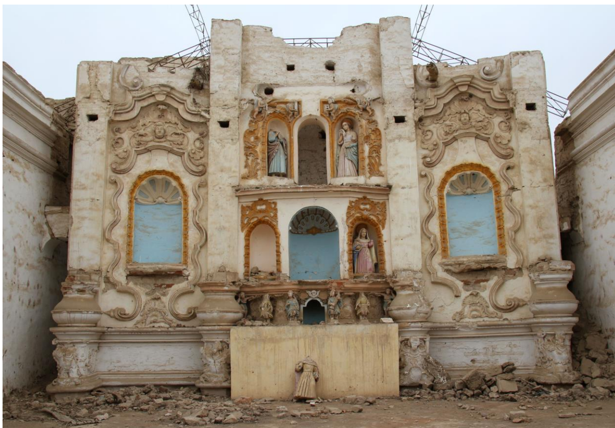
Departamento de Lima. Retablo mayor de la capilla perteneciente a la antigua hacienda Larán, en la provincia de Chincha. La capilla carece de techumbre y el retablo en obra de yesería está seriamente afectado. Es uno de los pocos ejemplos con ornamentaciones rococó en la costa central del Perú. Imagen: propia, 2017.

Las expresiones arquitectónicas del siglo XIX y primera mitad del XX, que abarcan desde las manifestaciones conocidas como “republicanas”, hasta los movimientos historicistas y eclécticos que abarcaron los movimientos “neos” (neogótico, neorrencentista, neocolonial, neoperuano y otros), solamente cuentan con una tutela de declaración de patrimonio en contados casos, siendo los más expuestos a desaparecer dentro de los proyectos de renovación de las ciudades, centros poblados y aun en propiedades rurales.