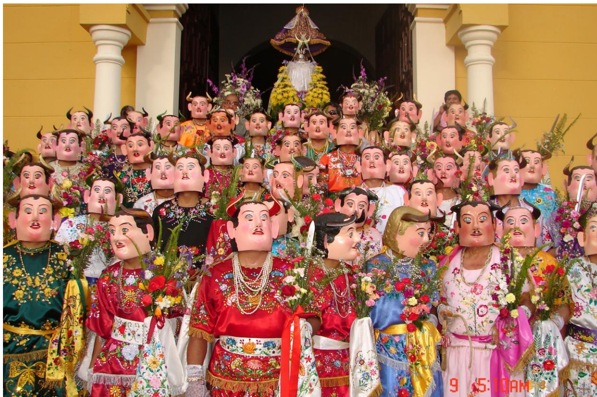
Departamento de Cajamarca, ciudad de Cajabamba. Fiesta en conmemoración a la Virgen del Rosario, que suele durar diez días en los que se alternan entre otros pregones, retetas, peleas de gallos, exhibición de caballos de paso, procesiones y misas en honor a la advocación. La fiesta termina con la señorial presentación de la danza de los Diablos y Galanes, que concluye frente al altar mayor de la iglesia matriz, donde los danzantes se rinden a los pies de la Virgen.

De los 5 195 sitios arqueológicos y edificaciones con valor monumental, registrados por el Ministerio de Cultura hasta abril de 2014 3 —de un total que la misma institución afirma debe llegar a los 100 000— menos del 1% corresponde a inmuebles rurales. El desamparo es total, siendo dejados a su suerte en el mejor de los casos, o demolidos para ampliar la frontera agrícola o para el desarrollo inmobiliario.