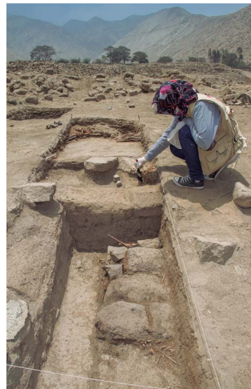
Fig. 5. Presencia de adobes paralelepípedos en las Pirámides con Rampa.

res, sin embargo, indicarían que algunas pirámides sí habrían funcionado a la vez. En consecuencia, dos o más señores habrían coexistido y competido por el prestigio y el acceso a recursos (Brumfiel 1994). Estas teorías, sin embargo, no se contradicen totalmente, puesto que si bien las evidencias indicarían que sí podría haber habido señores que coexistieron, también que varias de las pirámides se superpusieron a otras anteriores, lo que demostraría que no todas fueron usadas a la vez.