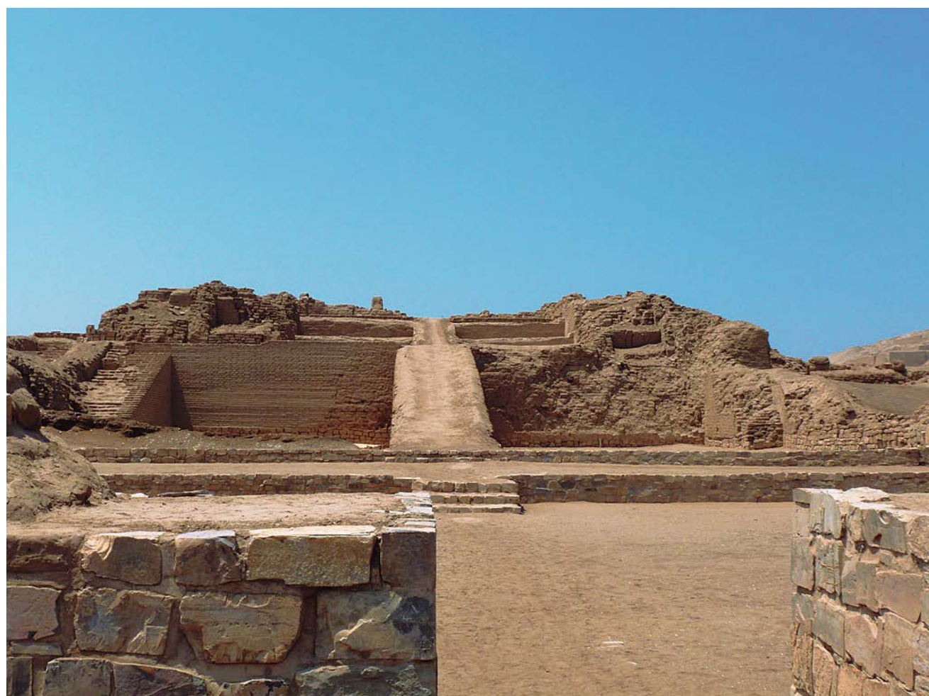
Fig. 1. Pirámide con Rampa en Pachacamac.

Las pirámides con rampa forman parte de una tradición arquitectónica característica de la costa central peruana en los periodos prehispánicos tardíos (fig. 1). Diversos autores se han referido a los elementos constitutivos principales que determinan que un edificio sea denominado “pirámide con rampa”. Jiménez Borja (1983) plantea que si bien varían en cuanto a tamaño y distribución de los espacios, estos edificios tienen una composición es similar. Todos presentan un patio delantero abierto, un volumen piramidal o pirámide trunca a la cual se accede a través de rampas y una serie de pequeños recintos o depósitos alrede-