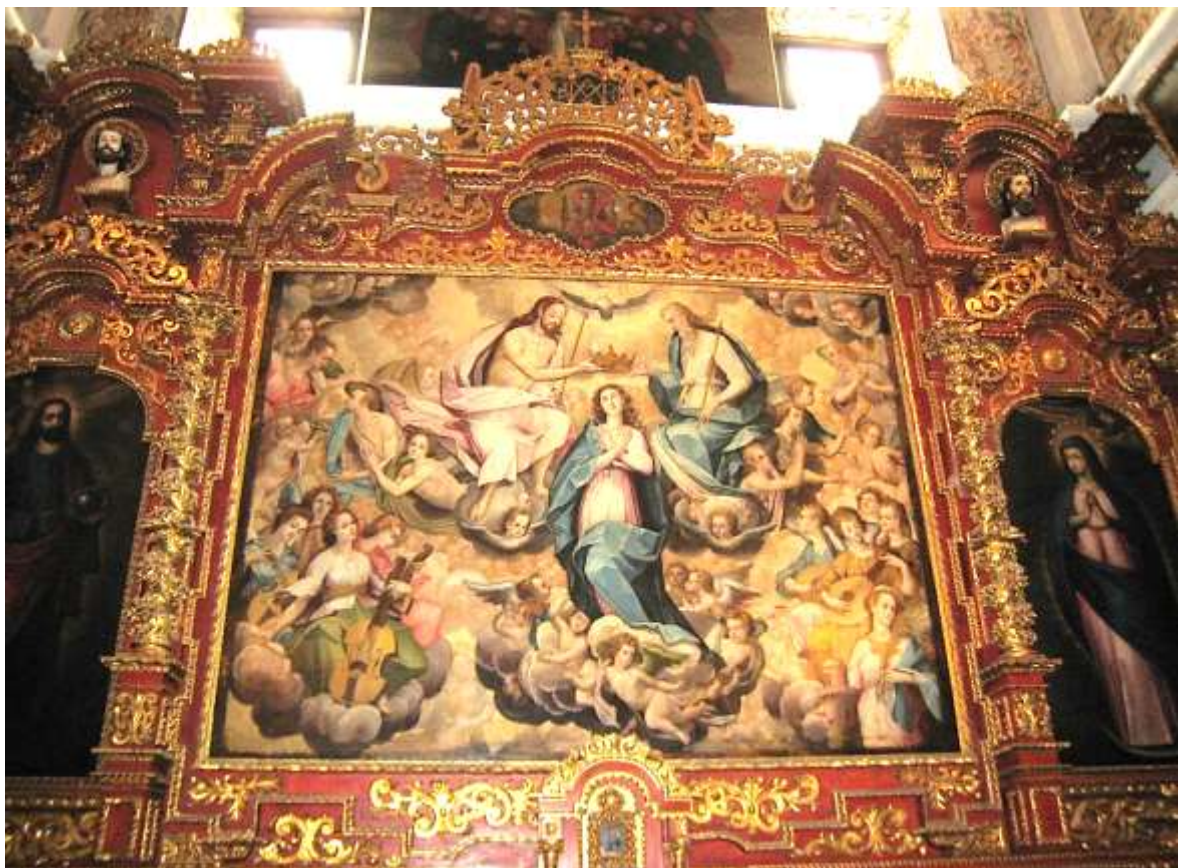
Coronación de la Virgen. Bernardo Bitti (ca. 1581) Sacristía de la Iglesia de San Pedro de la Compañía de Jesús.

Además de las piezas enviadas, el autor hace referencia a los artistas que llegaron al virreinato del Perú decididos a probar fama. Entre ellos destacan los escultores Martínez Arrona, Martín Alonso de Mesa y Pedro de Noguera, y los pintores manieristas Bernardo Bitti, Mateo Pérez de Alesio y Angelino Medoro, quienes influirán de manera determinante en las generaciones posteriores, especialmente en los pintores cusqueños.