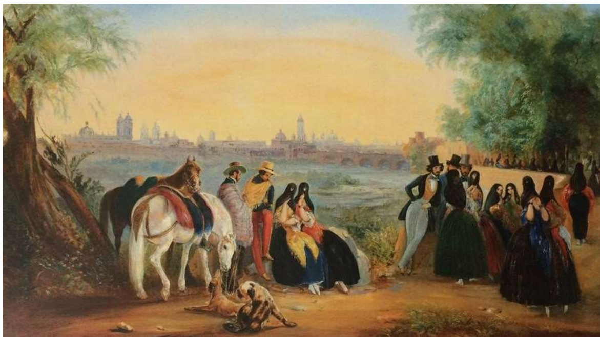
Paseo en la alameda nueva. Juan Mauricio Rugendas (1843).

Finalmente, señala los oficios que desempeñaron las mujeres durante el virreinato, destacando aquellos que corresponden a los anunciados en los pregones.