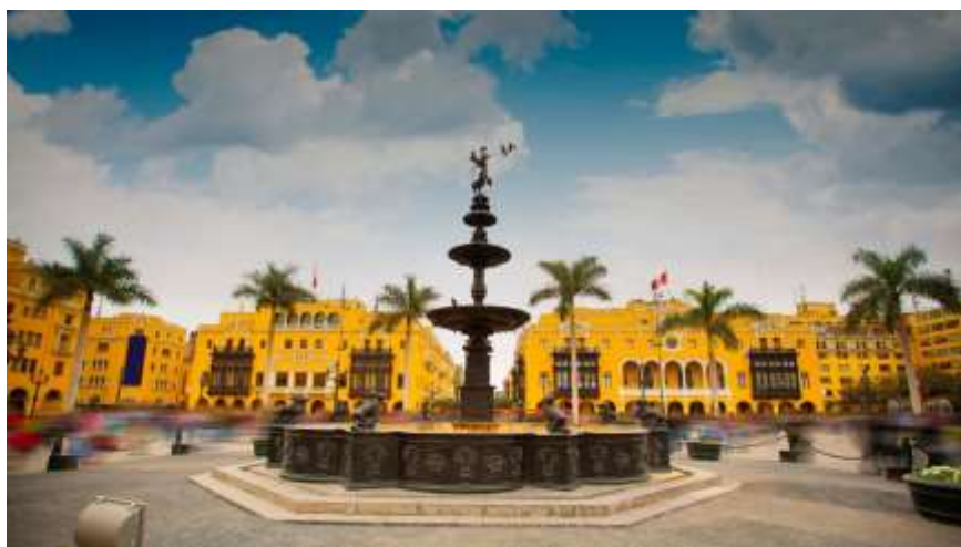
Plaza Mayor de Lima (Remodelación 1940-1952)