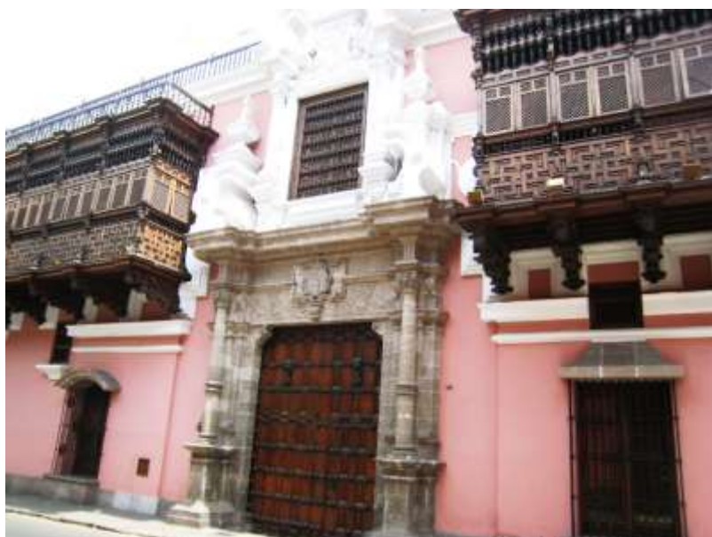
Casa Torre Tagle (1733-1740) Portada y balcones de cajón.