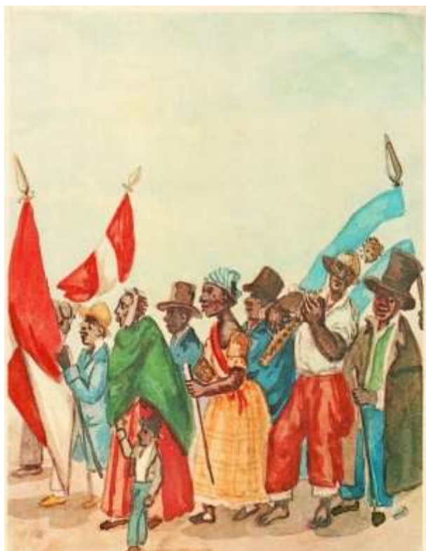
Cuadrilla de negros festejando el 28 de julio de 1821. Acuarela de Pancho Fierro.