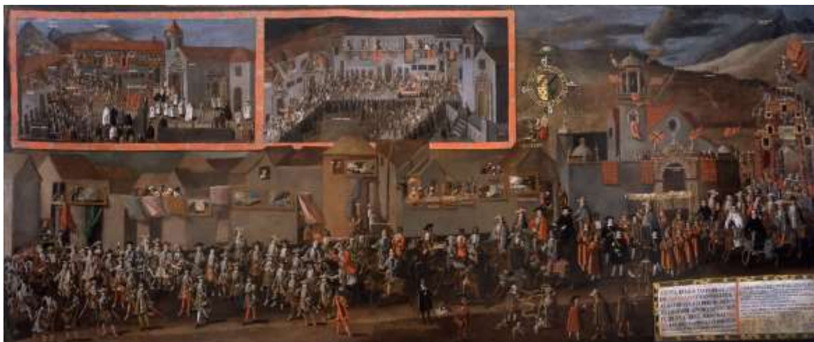
Entrada del arzobispo Virrey Morcillo en Potosí (1717). Lienzo de Melchor Pérez de Holguín (1718). Museo de América, Madrid. Imagen recuperada el 2.08.2024 desde https://goo.su/pSRnjX

Con respecto a la creación del Virreinato del Perú, explica su constitución y la designación de Lima como su capital convirtiéndose en la sede de las principales instituciones religiosas y administrativas. En el siglo XVII la opulencia y el poder de Lima eran evidentes y así lo expone el autor señalando las diferentes celebraciones y ceremonias públicas con la participación de diferentes grupos de la población que encontraban en lo ritual una forma de entender dinámicas de poder y convivencia en una realidad política negociada.