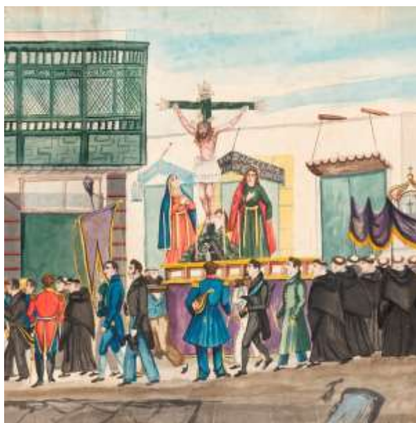
Procesión del Santo Cristo de Burgos.

Podemos leer en el texto cómo en Lima en el primer tercio del siglo XVII se fueron formando una serie de cofradías en las principales iglesias conventuales, las que participaban en las diferentes procesiones de la Semana Santa y que fueron descritas por el cronista Bernabé Cobo. En el siglo XVIII, siglo del barroco, la celebración llegó a su auge, incrementándose el número de cofradías y días de fiesta. Finalmente, el autor expone cómo en los siglos XIX y XX la festividad fue perdiendo su importancia, pese a ello algunas de las procesiones mantuvieron su recorrido. Destaca la pervivencia en Lima del Sermón de las Tres horas ideado por el jesuita limeño Francisco del Castillo en 1660.