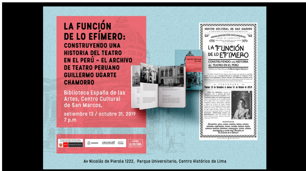
Cartel de la exposición: La Función de lo Efímero. Construyendo una Historia del Teatro para el Perú.

Pero lo más importante desde la perspectiva del urbanismo y del patrimonio cultural arquitectónico es resaltar que en el texto se hace una cartografía de los espacios culturales de la ciudad de Lima en la primera mitad del siglo XX. El propósito que establece el autor en su investigación es intentar construir un mapa de la ciudad en donde se puedan identificar los espectáculos de la época, las distancias físicas entre los teatros y su relación con los barrios circundantes. En la misma categoría se podrían incorporar las otras actividades de entretenimiento de la época como las corridas de toros y las peleas de gallos. En el mapa que anexamos se puede verificar un reconocimiento que hace el autor dentro del centro histórico de la ciudad con la presencia de muchos teatros de diferentes escala e índole, muchos de ellos desaparecidos. A partir de los años 30 el teatro adquiere un nuevo matiz y también se convierte en una expresión de la violencia política que se vive en esos años. Los políticos de turno son expuestos en el teatro a partir de la sátira, de la mofa y sobre todo relacionándolos con las posiciones partidarias e ideológicas de las facciones que luchan por el poder.